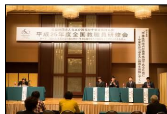
シンポジウムの様子